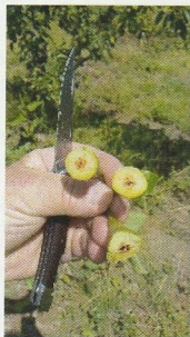
Dégâts de gel en arboriculture fruitière

Au total, 572 694 € ont été distribués en 2018 dans le département.